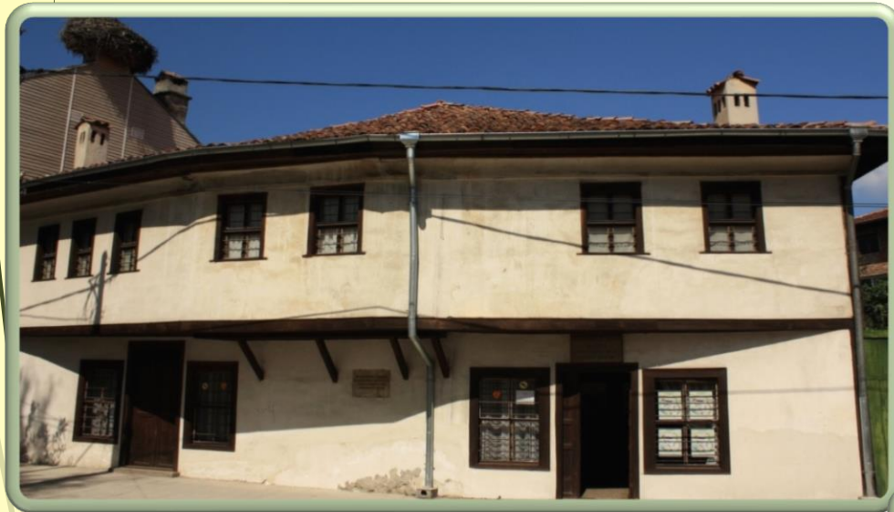
Външен изглед на къщата

➤ На първият етаж е разположена постоянната галерия “Борис Шаров”. Освен тази изложба в къщата се организират много временни изложби.