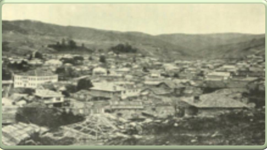
Батак през XIX век