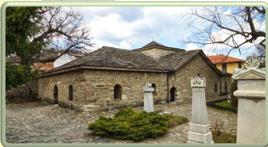
Външен изглед на църквата