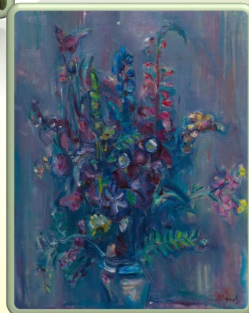
Натюрморт на Шаров