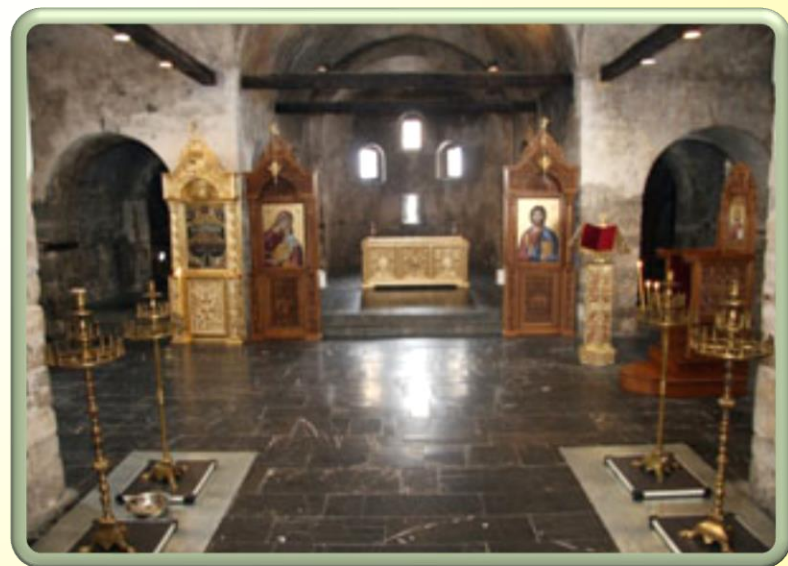
Вътрешен изглед на църквата