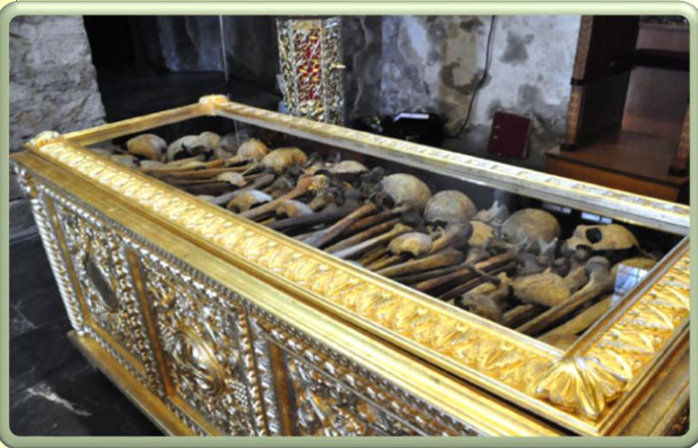
Кости на загиналите в църквата