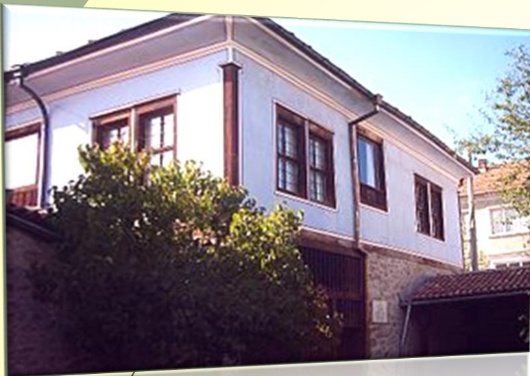
Външен изглед на къщата